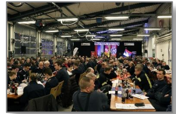
Versammlung 2018

Zu allen Terminen wird gesondert eingeladen!