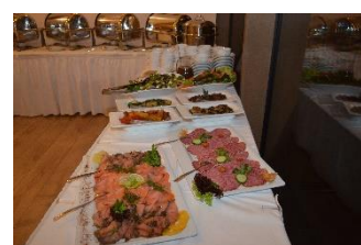
Buffet Essen 2018

Es ist geschafft! Bei DAS TUT GUT von der Sparkasse Lüneburg konnten wir 7.000 EUR ergattern. Am 06.12. fand die offizielle Übergabe an die Gewinner in der Kulturbäckerei statt. Mit großer Freude haben wir diesen Preis angenommen, um Kindern und Jugendlichen der Feuerwehr Lüneburg die lang ersehnten T-Shirts und Pullover kaufen zu können. Vielen Dank an alle, die unser Projekt unterstützt haben!