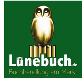
Logo Lünebuch

Einsendungen eurer Antworten postalisch oder einfach per Mail bis zum 13.01.2019 an die unten stehenden Kontaktdaten. Viel Erfolg!