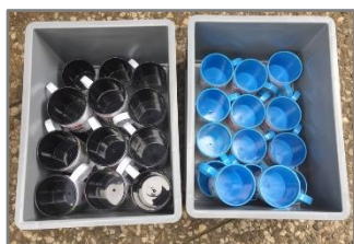
Becher für die KF